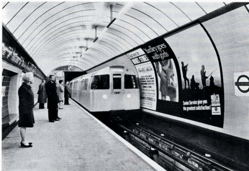
Væsentlige designprincipper fra Londons tunnelbaner – billedet herover er fra Seven Sisters station – indgår i de engelske højhastighedsprojekter. Der er både økonomi- og miljøfordele ved at anlægge højhastighedslinier som t-baner.

Togets vægt er kun 379 t i modsætning til hidtidige tilsvarende tog med samme kraftudvikling, der vejer 466 t. Også vægtreduktionen er resultat af et moderne t-banepincip – for det var på t-banen, ingeniørerne først anvendte aluminiumslegeringer i stedet for stål til det rullende materiel og i øvrigt bestræbte sig for at bygge letvægtstog .